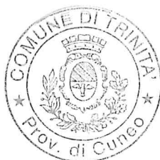
IL SINDACO Zucco Ernesta